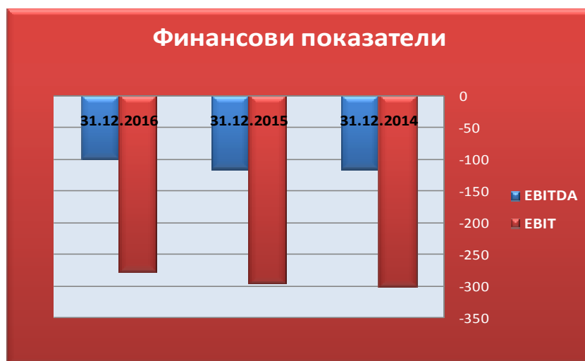
Таблица № 9