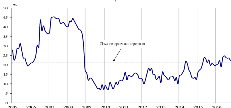
Фиг. 1. Бизнес климат - общо

Съставният показател „бизнес климат в промишлеността“ нараства с 2.3 пункта в сравнение с ноември, което се дължи на подобрените оценки и очаквания на промишлените предприемачи за бизнес състоянието на предприятията. Същевременно обаче осигуреността на производството с поръчки се оценява като леко намалена, което е съпроводено и с понижени очаквания за производствената активност през следващите три месеца.