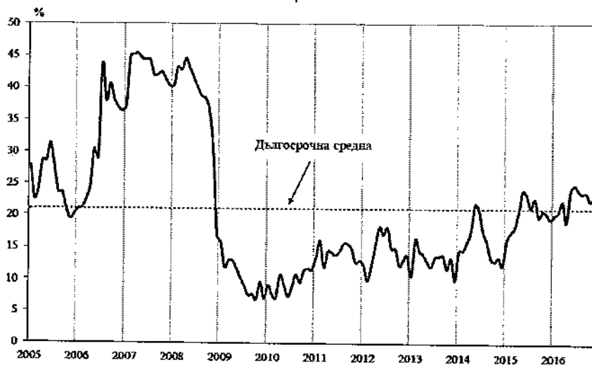
Фиг. 1. Бизнес климат - общо

Съставният показател „бизнес климат в промишлеността“ нараства с 2.3 пункта в сравнение с ноември, което се дължи на подобрените оценки и очаквания на промишлените предприемачи за бизнес състоянието на предприятията. Същевременно обаче осигуреността на производството с поръчки се оценява като леко намалена, което е съпроводено и с понижени очаквания за производствената активност през следващите три месеца.