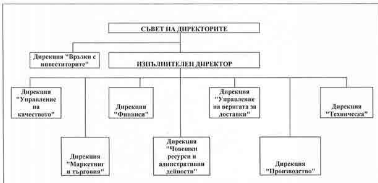
Управленска и организационна структура на Херти - АД