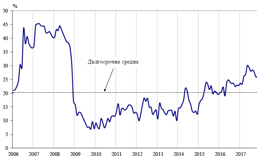
Фиг. 1. Бизнес климат - общо

на услугите, докато в търговията на дребно запазва приблизително равнището си от предходния месец.